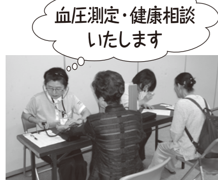
看護師が血圧測定や健康の悩みをお聞きします。