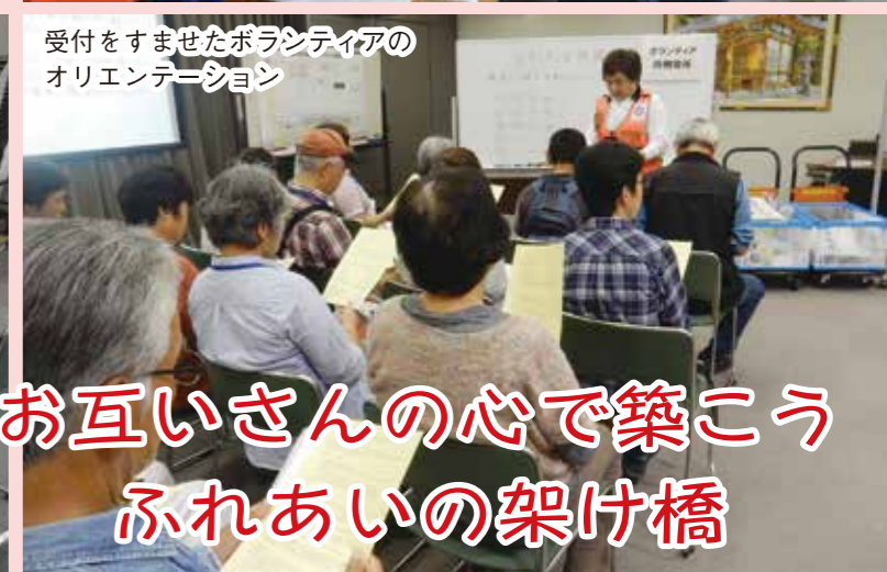
受付をすませたボランティアのオリエンテーション