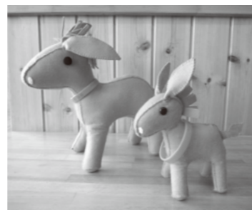
マスコットキャラのロバ隊長

まずはお問い合わせください。社協ケアプランセンター TEL 0774-65-3286