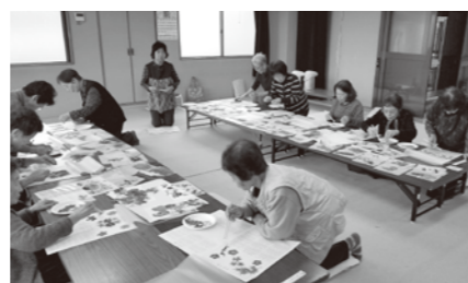
押し花カレンダーづくり