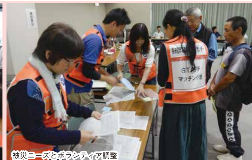
被災ニーズとボランティア調整