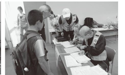
貸し出す資機材をチェック