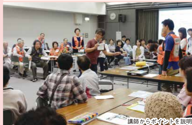
講師からポイントを説明