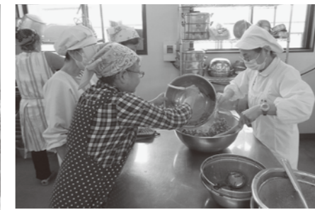
災害食でランチミーティング