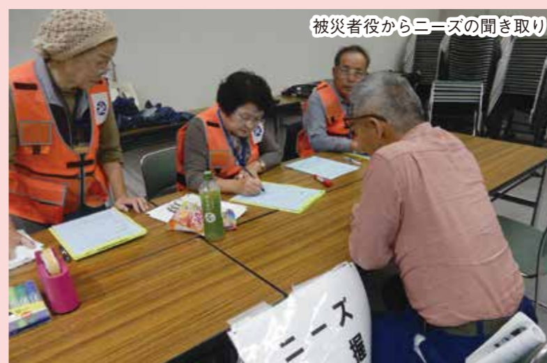
被災者役からニーズの聞き取り