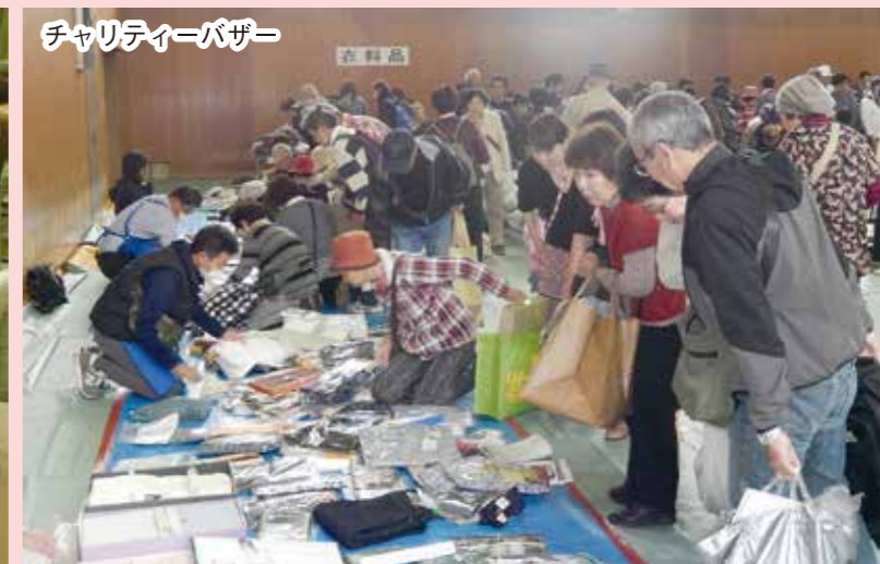
チャリティーバザー