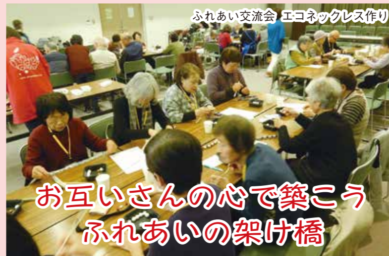
ふれあい交流会 エコネックレス作り