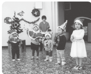
打田区ミニクリスマス会