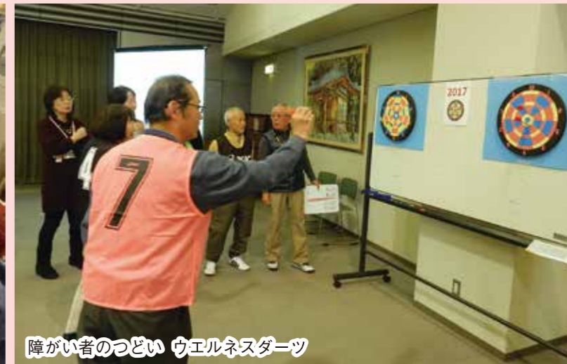
障がい者のつどい ウェルネスダーツ