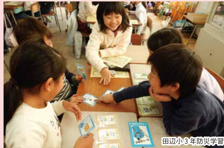
田辺小3年防災学習