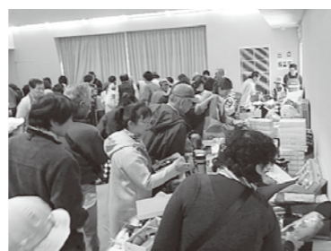
3階 日用品・雑貨売り場の様子