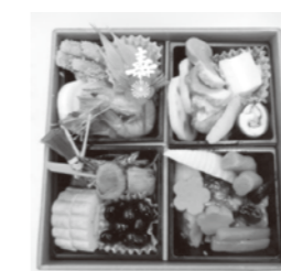
大晦日にひとり暮らし高齢者等にお届けしたおせち料理