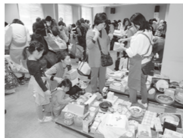
2階 陶器売り場の様子

あらためまして商品を提供いただきました市民の皆様をはじめ、地域での提供品の収集作業や値段付け作業、当日のお手伝いなどご協力をいただきました多くの皆様にお礼申し上げます。