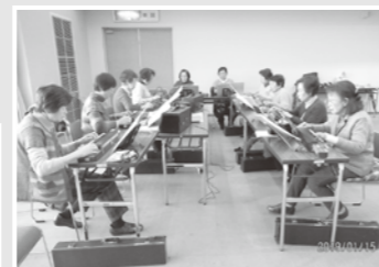
社会福祉センターでの練習の様子

施設訪問等によって高齢者や障がいのいる方などとのコミュニケーションによるふれあいを楽しんでもらっています。