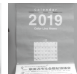
公共施設において配布したカレンダー