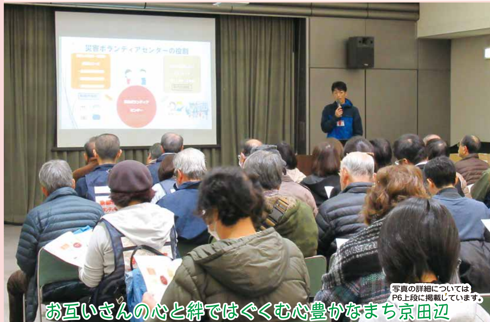
写真の詳細についてはP6上段に掲載しています。