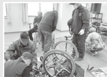
車いすのパンク修理