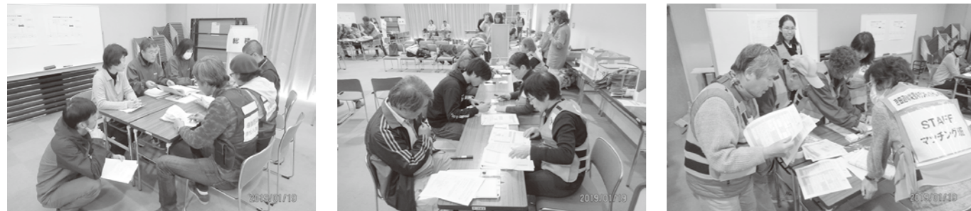
研修時の様子（ロールプレイで実際の流れに沿って訓練を実施しました。左から総務班、V受付班、マッチング班）