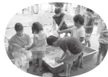
ASUVID京田辺(同志社大学学生ボランティアサークル)との水遊び