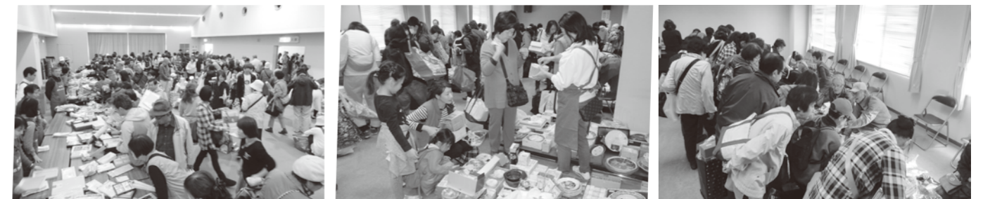
昨年度、初めて社会福祉センターで開催した時の様子