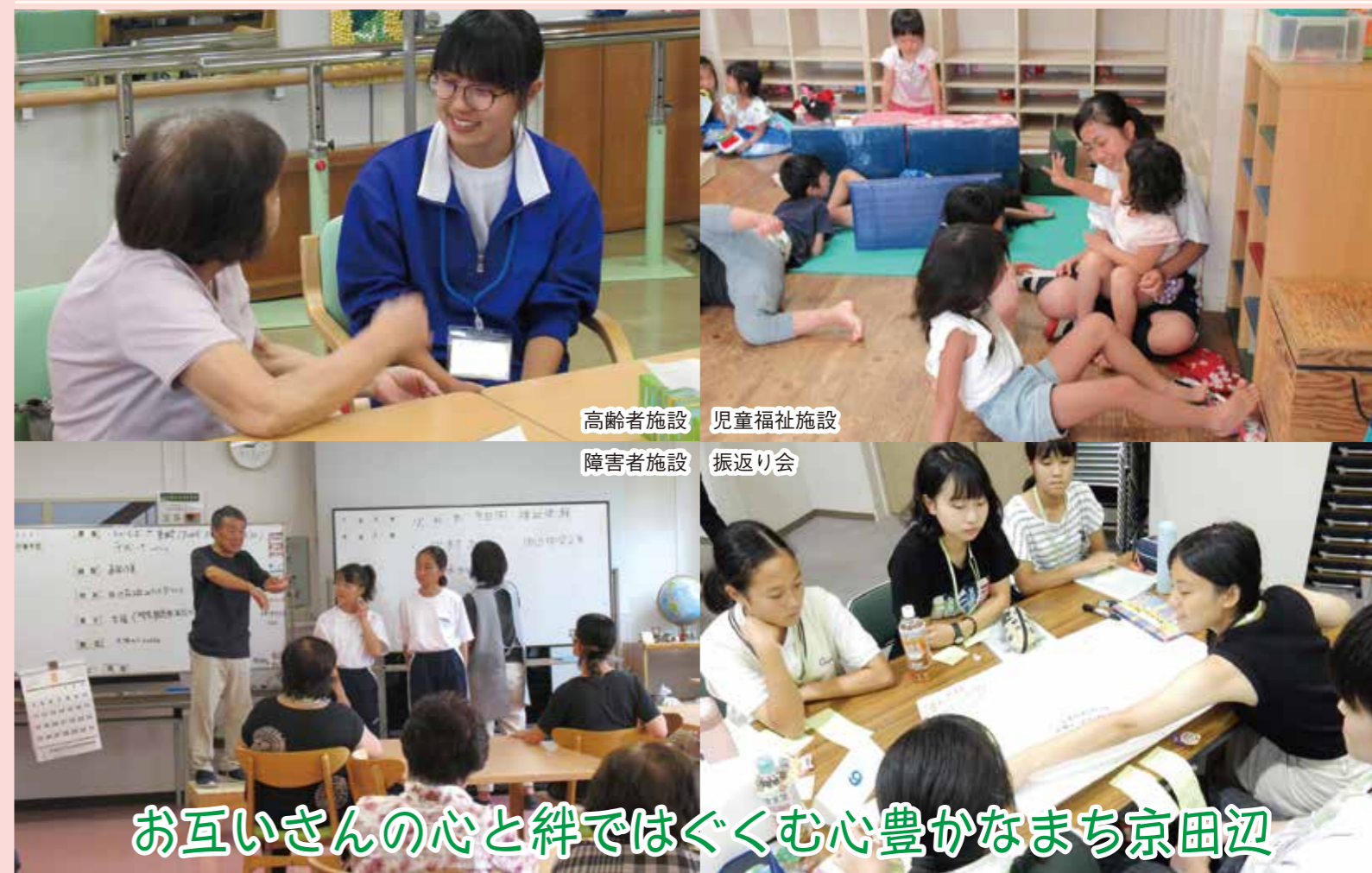
高齢者施設 児童福祉施設 障害者施設 振り返り会