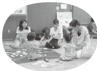
同志社女子大学学生ボランティア手作りの魚釣り遊び