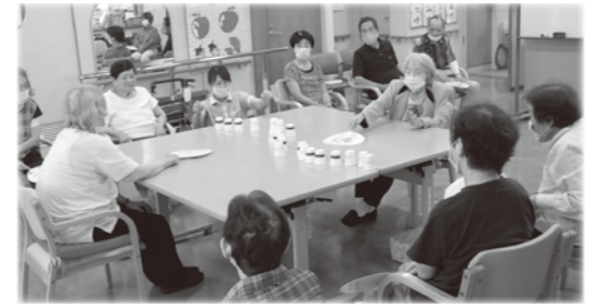
【レクリエーション「陣取りうちわ」のようす】

所在地 〒610-0311 京田辺市草内五ノ坪6 老人福祉センター常磐苑内 電話 0774-63-5566 FAX 0774-63-5706 利用時間 9:00~16:00 休日 土曜日・日曜日・祝祭日・年末年始(12月28日~翌1月3日) ただし、本会の指定する土曜日については営業を行います。