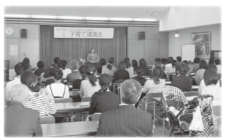
【「子育て講演会」のようす】