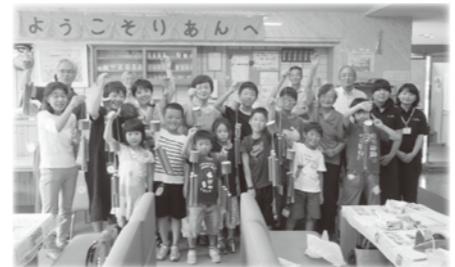
【「りあんへいこっ!プロジェクト」のようす】