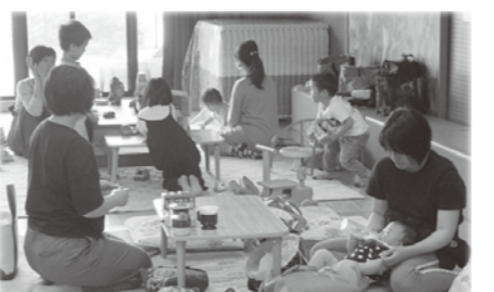
【「いつでもだれでも」のようす】