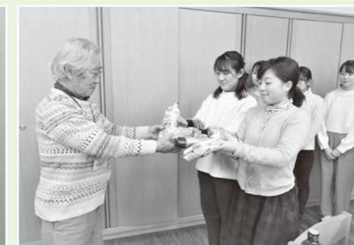
同志社女子大フードドライブ