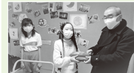
同志社国際学院初等部フードドライブ