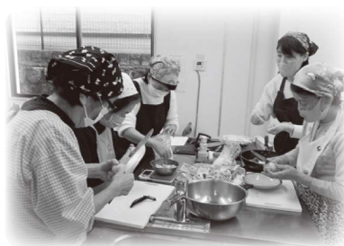
【第1回食事の介護講座】

社協では介護講座を通して介護をする人、介護を受ける人、そして地域に住む人誰もが安心して年を重ね、暮らしやすいまちへつながっていく機会になることを願い、今後も講座を開催していきます。