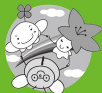
市社協マスコットキャラクター