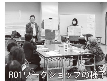
R01ワークショップの様子

こうしたワークショップやアンケートを通していただいたご意見は、令和5年度からの第4次地域福祉活動計画に盛り込み、地域や住民の皆さんと共に支えあい助けあうまちづくりを進めていきます。