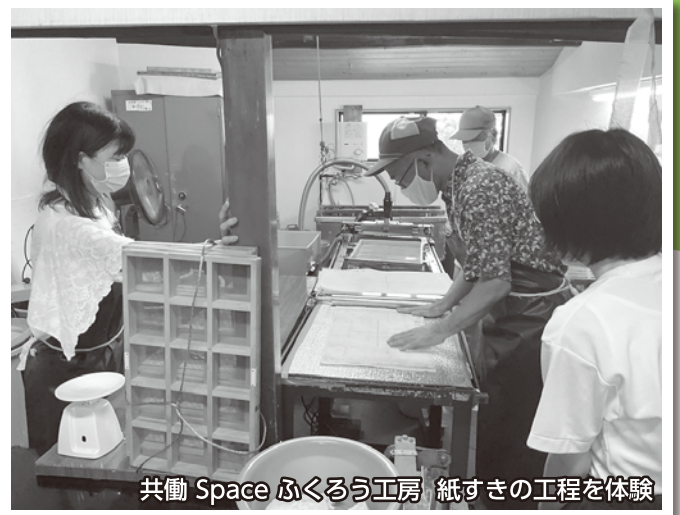
共働 Space ふくろう工房 紙すきの工程を体験