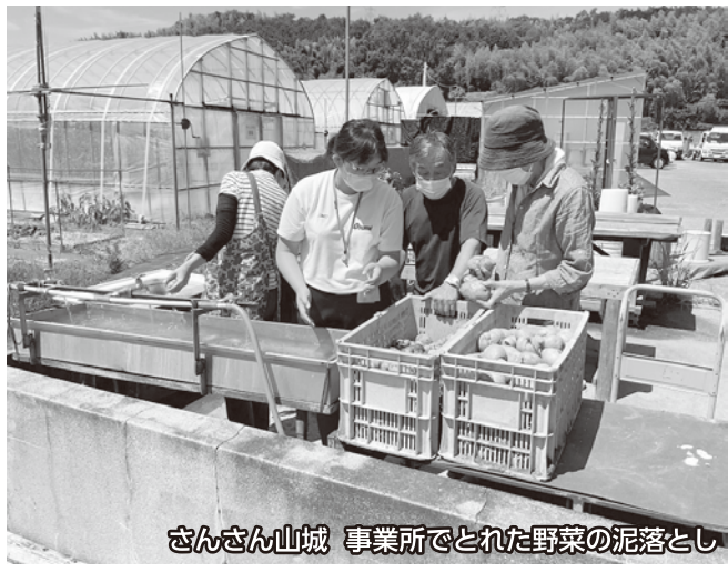
さんさん山城 事業所でとれた野菜の泥落とし