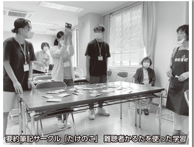
要約筆記サークル「たけのこ」 難聴者かるたを使った学習