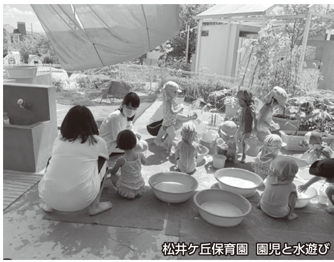
松井ヶ丘保育園 園児と水遊び