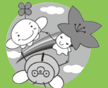
市社協マスコットキャラクター