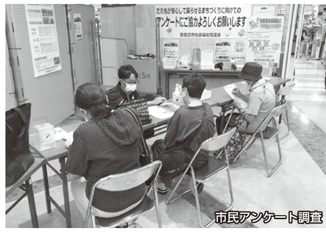
市民アンケート調査