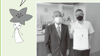
施設への贈呈の様子