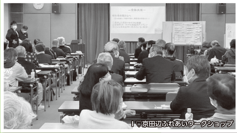
I♡京田辺ぶれあいワークショップ