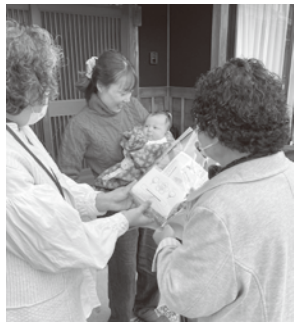
民生委員による赤ちゃん訪問