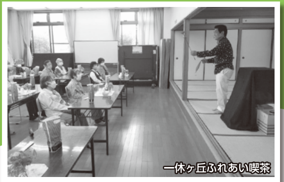
一休ヶ丘ぶれあい喫茶