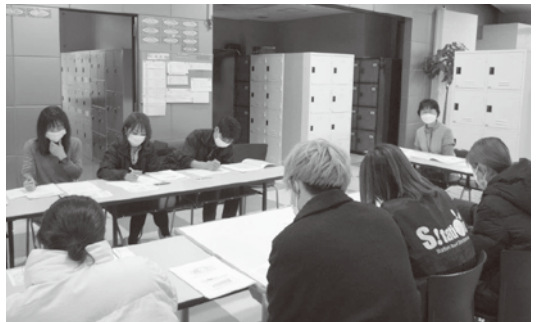
認知症サポーター養成講座（市内のポーリング場での出前講座）