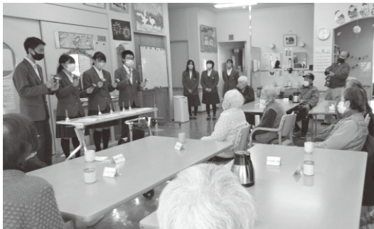
培良中の生徒による施設訪問（常磐苑デイサービスセンター）