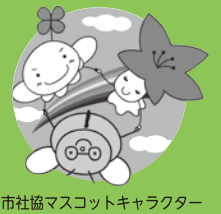
市社協マスコットキャラクター

社協基本理念：～お互いさんの心と絆ではぐくむ心豊かなまち京田辺～ ～育てよう 支えあう 絆でつなく ぶれあいネットワーク～