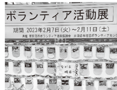
ボランティア活動展