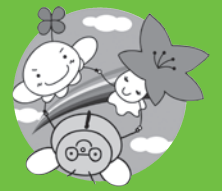
市社協マスコットキャラクター

～お互いさんの心と絆ではぐくむ心豊かなまち京田辺～ ～みんなが自分らしく輝けるまちへ つなげよう未来～