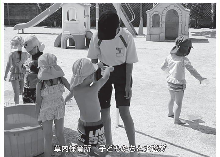
草内保育所 子どもたちと水遊び