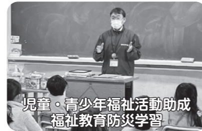
児童・青少年福祉活動助成 福祉教育防災学習