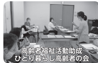
高齢者福祉活動助成 ひとり暮らし高齢者の会