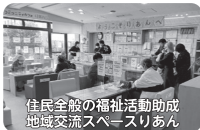
住民全般の福祉活動助成 地域交流スペーススリあん