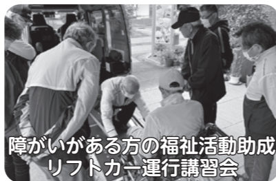
障がいがある方の福祉活動助成 リフトカー運行講習会