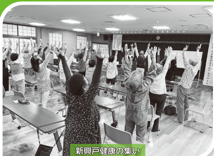
新興戸健康の集い

～お互いさんの心と絆ではぐくむ心豊かなまち京田辺～ ～みんなが自分らしく輝けるまちへ つなげよう未来～