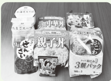
年越しセットのイメージ

【セットの内容】 お赤飯、みそ汁、たまごスープ、ぜんざい、親子丼、中華丼、カップそば、丹波黒豆、たけのこ土佐煮、椎茸うま煮