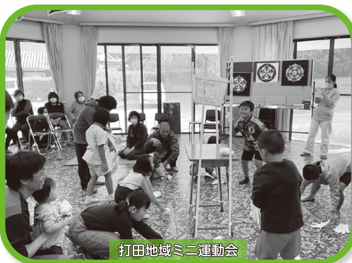
打田地域ミニ運動会

10月22日(日) 10:00から山崎公民館において、地震等の災害を想定した出前講座を開催。地震が起こる前に備えるべきことや災害時の対応等について、クイズ形式で学び、実際の避難や地域の状況について意見を交わしました。