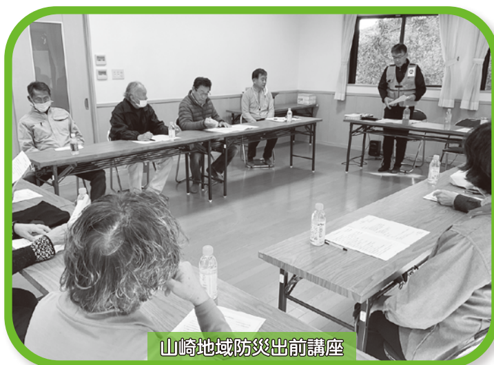
山崎地域防災出前講座