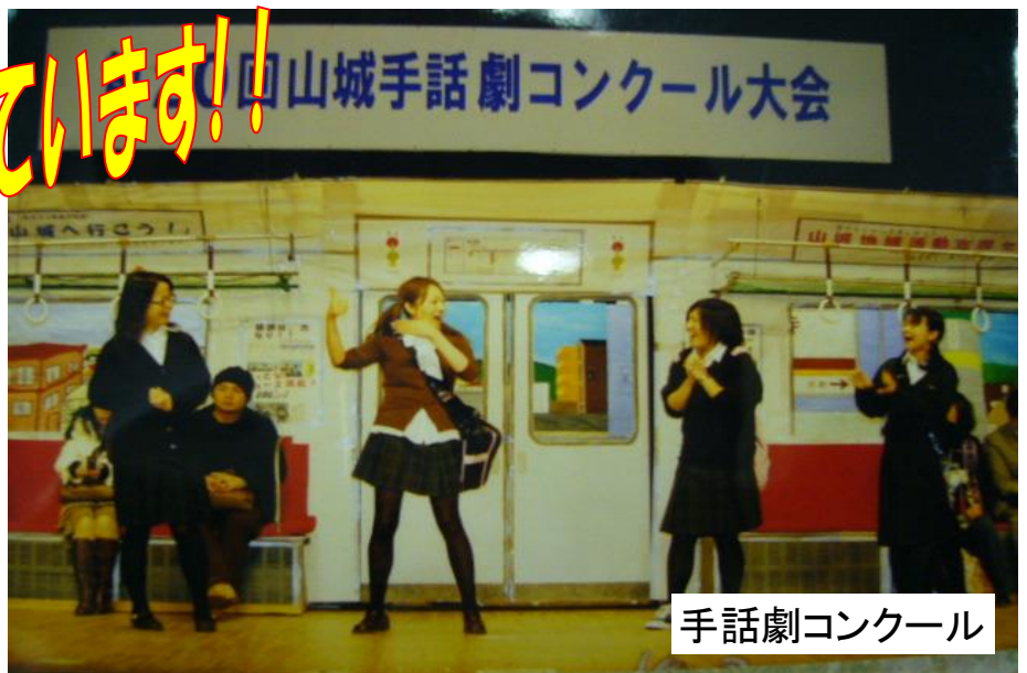
手話劇コンクール