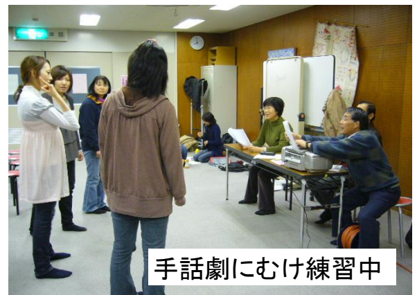
手話劇にむけ練習中