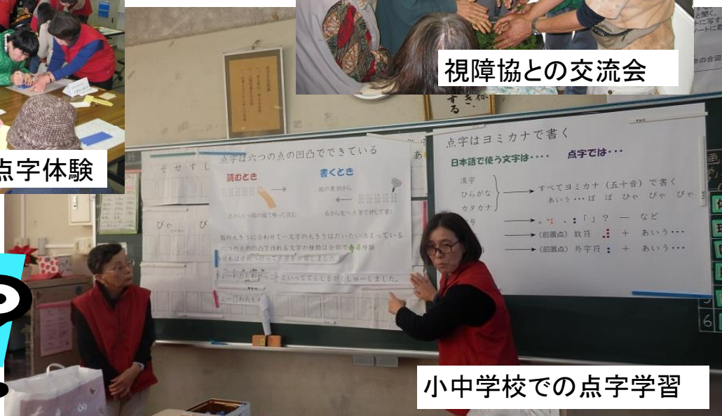
小中学校での点字学習