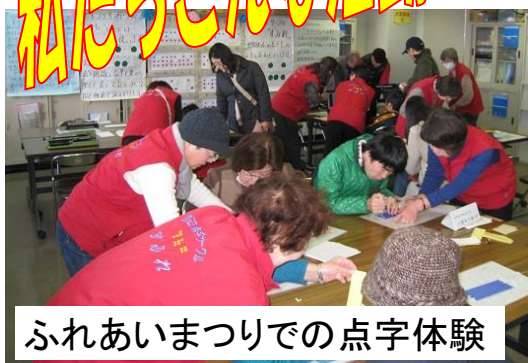
ふれあいまつりでの点字体験