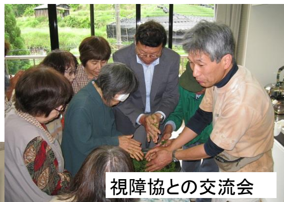
視障協との交流会