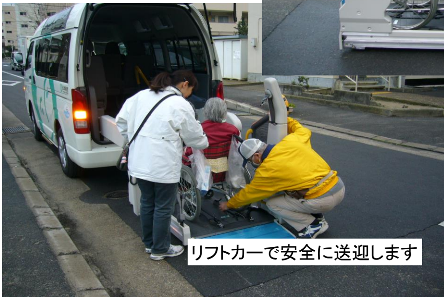
リフトカーで安全に送迎します